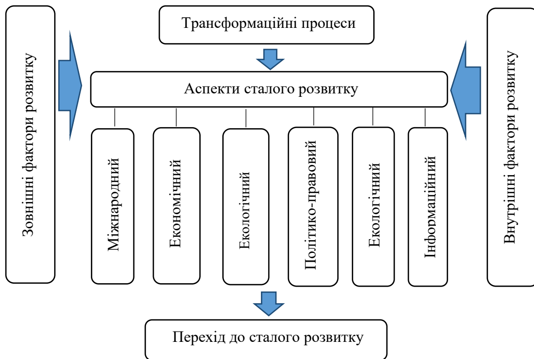
Рисунок 2. Напрямок трансформаційних процесів в контексті сталого розвитку

загальної справи створення кращого майбутнього. Тому усі аспекти сталого розвитку діють одночасно та тісно пов'язані між собою і повинні впроваджуватися одночасно з урахуванням національних, регіональних, економічних, міжнародних та інших особливостей (рис. 2).