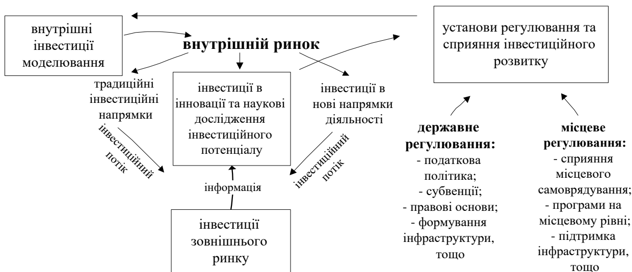
Рисунок 2 - Узагальнююча схема регулювання інвестиційних процесів та дослідження інвестиційного потенціалу у постсоціалістичних країнах (Угорщина, Польща, Чехія)

Отже, регулювання інвестиційних процесів та дослідження інвестиційного потенціалу у постсоціалістичних країнах (Угорщина, Польща, Чехія) здійснюються на основі трьох напрямків: інвестиції в інновації, інвестиції в дослідження інвестиційного потенціалу, інфраструктура інвестиційної діяльності (рис. 2).