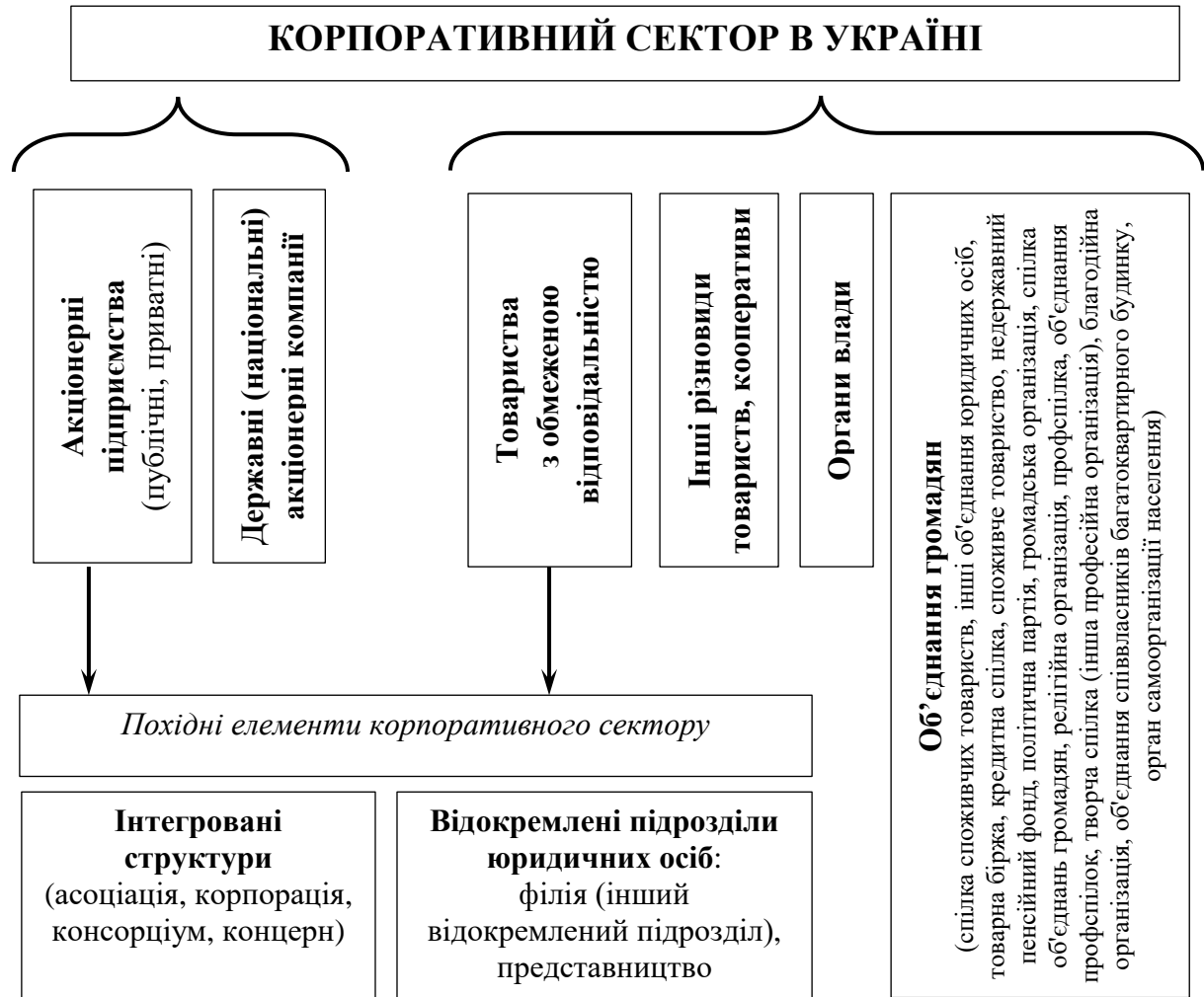
Рис. 1. Складові елементи корпоративного сектору в Україні

У теперішній час корпоративний сектор в Україні представлено трьома складовими: акціонерною, неакціонерною і похідною (рис. 1).