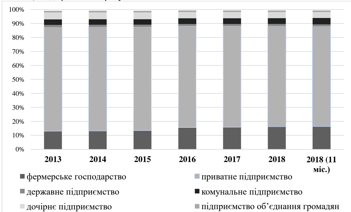
Рис. 2. Питома вага підприємств різних форм власності до їх загальної кількості за період з 2013 до 2018 років, станом на початок року [3]

Проведемо дослідження структурних зрушень у корпоративному секторі України за вказаними категоріями за період з 2013 до 2018 років (рис. 2). Загальна кількість юридичних осіб протягом дослідженого періоду скоротилась із 1,34 до 1,29 млн одиниць, чи на -3,6% до рівня 2013 року.