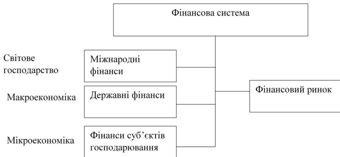
Рис. 1. Сфери фінансових відносин

На думку автора, кожна з цих сфер має відповідне організаційне забезпечення, кожна рівнева сфера — певний склад доходів та витрат (витрат) та свою специфічну схему організації фінансової діяльності, а фінансовий ринок — форми фінансових ресурсів та методи торгівлі ними.