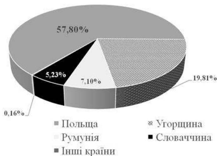
Рис. 2. Структура географічного розподілу туристичних потоків українців до країн ЄС за період функціонування безвізу (11.06.2017 – 11.09.2017) [4]

Ще одним доказом того, що безвізовим режимом скористалися за перший тримісячний період громадяни України, які за будь-яких обставин (навіть без введення безвізу) планували поїздку до ЄС – є невелика кількість відмов у в'їзді до ЄС. У період з 11.06.2017 по 11.09.2017 було відмовлено у в'їзді до країн Євросоюзу всього 61 громадянину України, що становить лише 0,0044% загальної кількості українців, які слідували до ЄС з біометричними паспортами. Основна причина відмов: перевищення терміну перебування на території країни попереднього в'їзду [4].