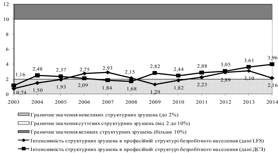
Рис. 2. Інтенсивність структурних зрушень професійної структури безробітного населення (у відповідності до базового 2002 року)

розпочався процес інтенсифікації структурних зрушень, максимальні зрушення були досягнуті у 2013 році – 3,1%.