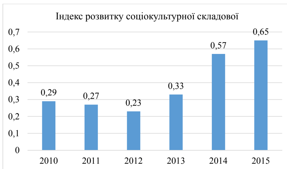
Рис.2. Динаміка зміни індексу розвитку соціокультурної складової трудового потенціалу України

Як відомо - субкультура представляє собою моделі переконань, цінностей, норм, зразків поведінки, характерних для певної соціальної спільноти, які відрізняють цю спільноту від суспільства в цілому [8]. Це соціальне об'єднання, що характеризується тим, що кожен з його представників зараховує себе до нього, тобто ідентифікує себе з ним. Члени такого угруповання можуть формувати групи безпосереднього спілкування (компанії, клуби, тусовки), але їхній зв'язок одне з одним може відбуватися і віртуально, завдяки захопленню одним героєм або спільною ідеєю (толкієністи, поттеромани, вейпери, вегани та ін.).