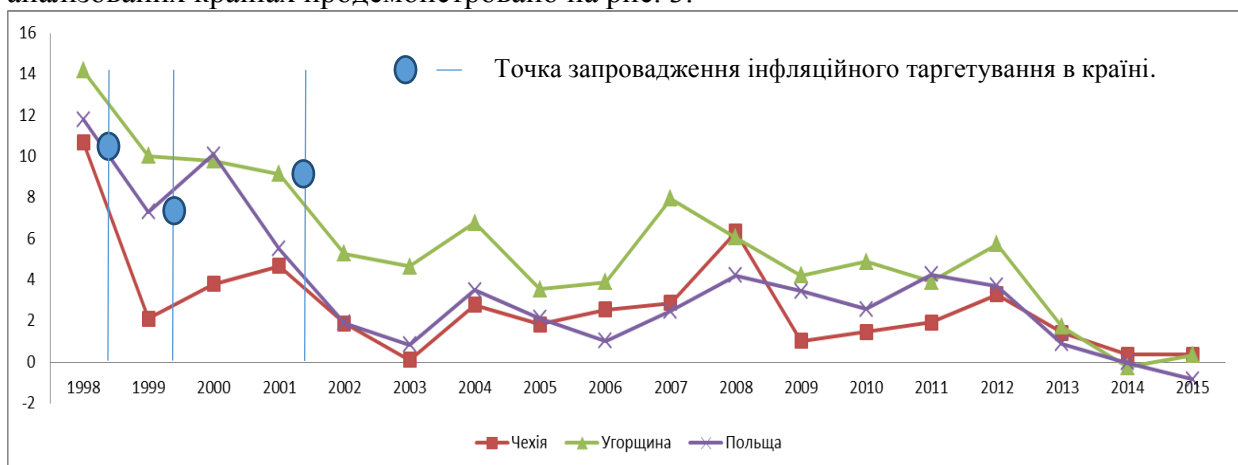
Рис.3. Динаміка темпу інфляції країн впроваджувачів інфляційного таргетування

При аналізі інфляційного таргетування доцільно було б дослідити досвід країн світу, які ввели даний монетарний режим, та зміни в економічних показниках, що відбулися після його запровадження. Зокрема доречно розглянути наступні країни: Польща режим інфляційного таргетування запроваджено у 1999р., Угорщина – 2001 р., Чехія – 1998 р. Якісні зміни, що відобразились на значенні темпу інфляції в аналізованих країнах продемонстровано на рис. 3.