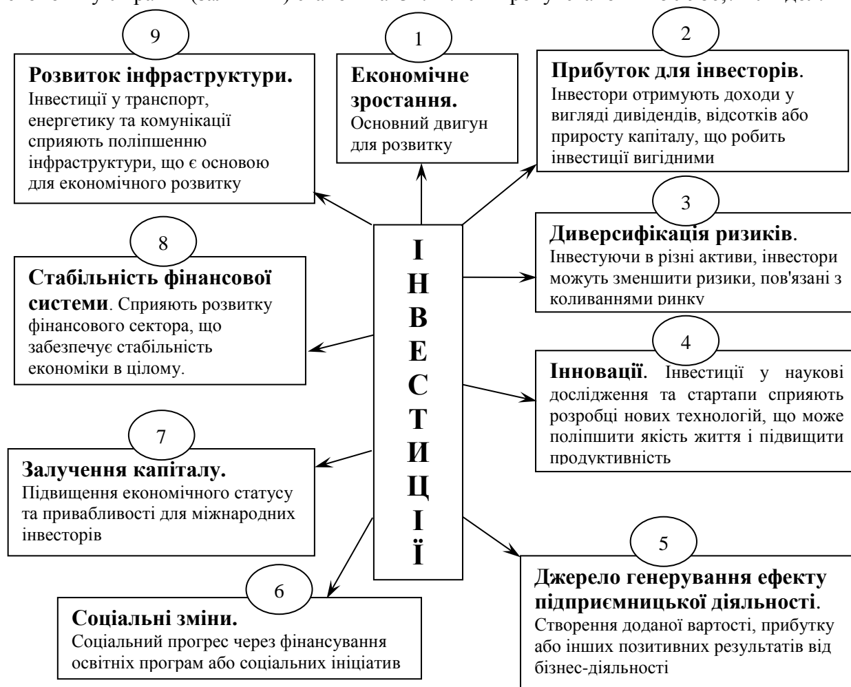
Рисунок 1 – Роль інвестицій у економіці та суспільстві

За даними Національного банку України обсяг прямих іноземних інвестицій[1] в економіку України (залишків) станом на 31.12.2022 року становив 50 986,7 млн дол.