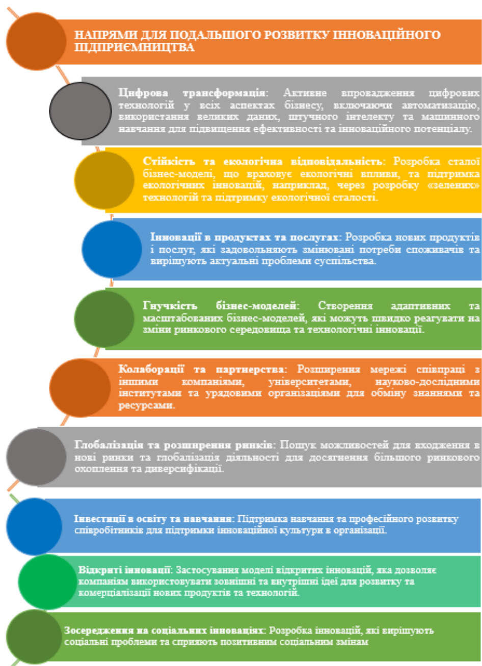
Рис. 5. Напрями подальшого розвитку інноваційного підприємництва