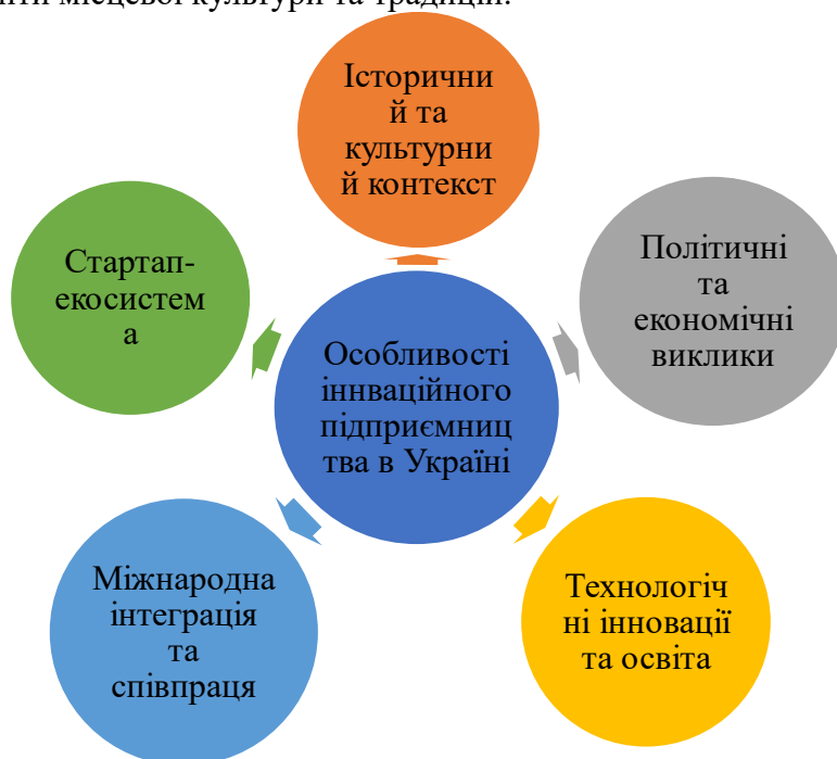
Рис. 3. Особливості інноваційного підприємництва в Україні

4. Історичний та культурний контекст: Україна має багату історію та культуру, яка впливає на стиль ведення бізнесу. Це створює унікальний підхід до інновацій, який часто залучає елементи місцевої культури та традицій.