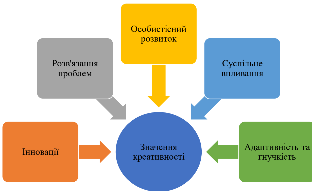
Рис. 2. Значення креативності у її здатності стимулювати інновації та прогрес

5. Адаптивність та гнучкість: у швидкозмінному світі креативність допомагає людям адаптуватися до нових викликів та обставин, розвиваючи гнучкість мислення та відкритість до нових ідей.