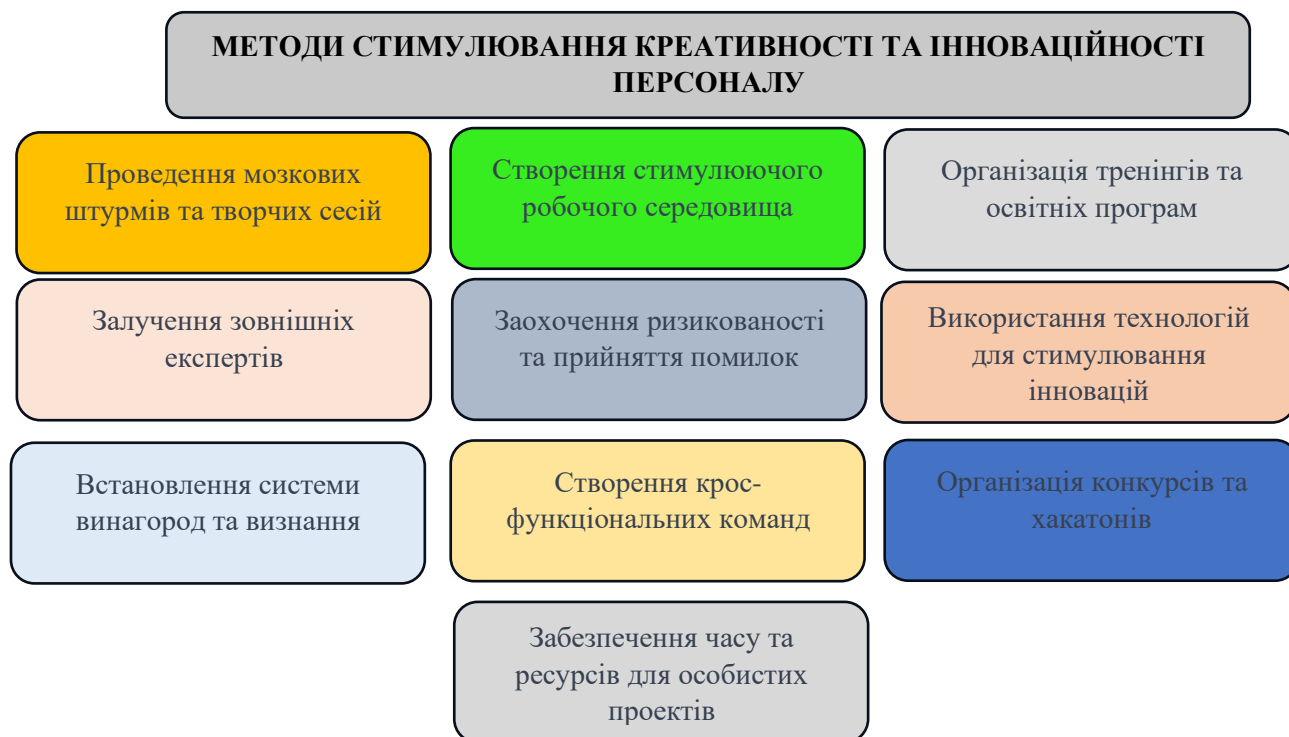
Рис.4. Методи стимулювання креативності та інноваційності персоналу