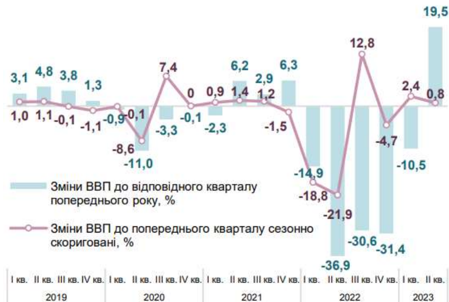
Рисунок 1 - Динаміка ВВП в Україні у 2019-2023 рр. [10, с. 4]

1. за оцінками Мінекономіки у вересні 2023 р. (порівняно з вереснем 2022 року) реальний ВВП збільшився на 9,1% [ \pm 2\% ] [10, с. 4]. Динаміка ВВП в Україні у довоєнний та воєнний періоди представлена на рис.1. З представленого рисунку видно, що у II кварталі 2023 р. вперше з початку повномасштабного вторгнення РФ в Україну зафіксовано зростання ВВП до відповідного періоду попереднього року. Це безумовно є індикатором поступової адаптації національної економіки до умов воєнного стану.