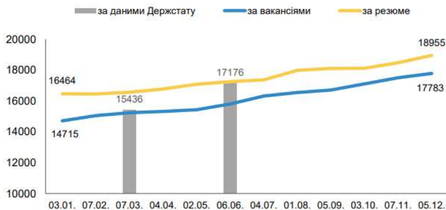
Рисунок 3 - Динаміка середньої заробітної плати в Україні за 11 місяців 2023 р., грн [6, с.25]

4. Поступове зростання рівня заробітної плати в економіці з метою утримання та залучення нового висококваліфікованого персоналу в умовах дефіциту робочої сили в країні (рис.3).