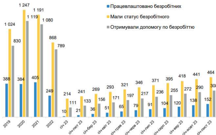
Рисунок 4 - Показники ринку праці в Україні за 11 місяців 2023 р., тис осіб [6, с.24]

Щодо впливу процесів поживлення економіки на стан ринку праці, слід зауважити, що на фоні певного зростання кількості вакансій та попиту на персонал, рівень безробіття в країні продовжує бути на рівні вищому за довоєнний, а кількість осіб, що мають статус безробітних у 2023 р. помісячно зростає (рис.4).