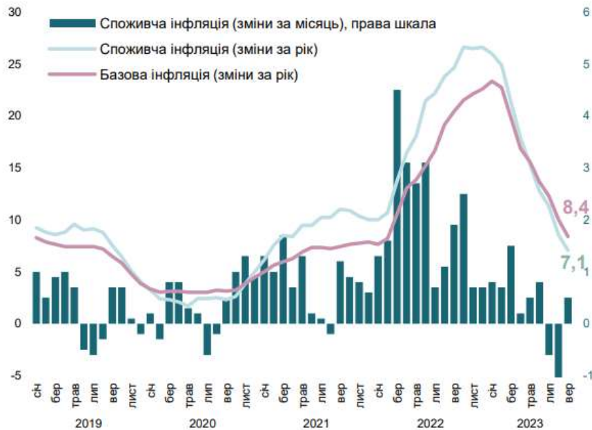
Рисунок 2 - Динаміка показників інфляції в Україні у 2019-2023 рр. [10, с. 5]

місяців 2023 року ціни зросли лише на 3%, а річні темпи у вересні уповільнилися до 7,1% (рис.2) [10, с. 5]. З представленою рисунком видно, що починаючи з 2022 р. в липні та серпні 2023 р. вперше мало місце від'ємне значення показника темпів зростання споживчої інфляції, яке свідчить про уповільнення її темпів.