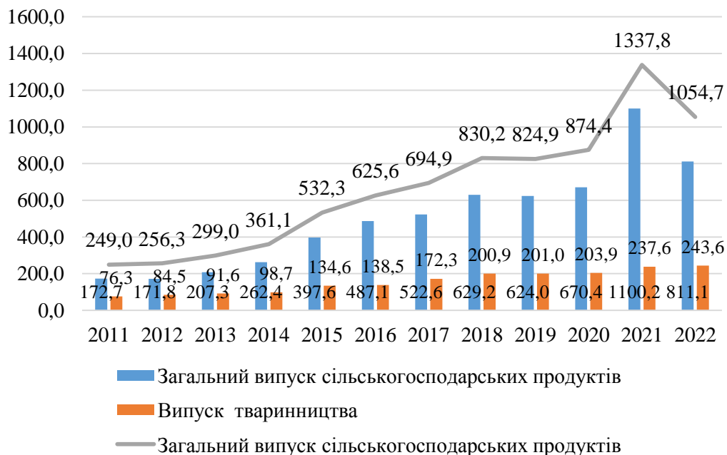
Рисунок 1 - Обсяги випуску продукції рослинництва та тваринництва за 2011-2022 роки, млрд. грн.

Для розуміння економічної складової конкурентоспроможності українських аграрних підприємства виконаємо аналіз динаміки економічних рахунків індустрії сільського господарства (за статистичними даними Державної служби статистики України [10] на рис. 1.