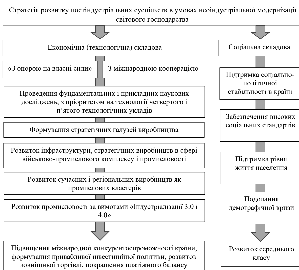
Рисунок 1. Стратегія розвитку постіндустріальних суспільств в умовах неоіндустріальної модернізації світового господарства