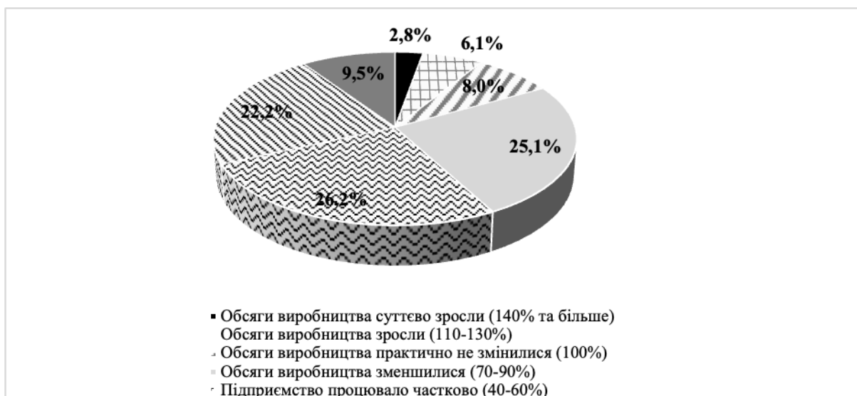
Рисунок 1. Результати функціонування бізнесу в Україні у 2022 році порівняно з попереднім періодом [3].

Як бачимо, наслідки війни досить негативно відобразилися на економічній діяльності підприємств в Україні, у зв'язку з чим відбулось також безпрецедентне падіння рівня ВВП на 29,1%. Це призвело до суттєвих проблем у всіх сферах та галузях господарської діяльності. А необхідність переорієнтації бізнесу в нових умовах на більш складні ланцюги постачання, девальвація національної валюти, проблеми з електропостачанням тощо, призвели до суттєвого скорочення обсягів виробництва на багатьох підприємствах.