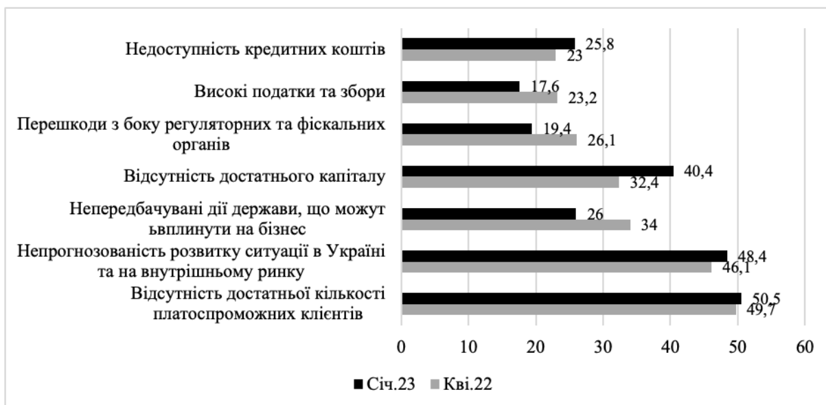
Рисунок 3. Перешкоди розвитку бізнесу в Україні у 2022-2023 р. згідно опитувань підприємців [3]

1. Створення сприятливого бізнес-середовища – для забезпечення підтримки малого і середнього бізнесу необхідно сформувати сприятливе середовище для бізнесу, яке б передбачало широкі можливості для здійснення підприємницької діяльності, низькі адміністративні бар'єри, а також загальне зменшення бюрократичних процедур та впровадження електронних сервісів для реєстрації бізнесу. Наразі дана ініціатива частково реалізується згідно програми цифрової трансформації та впровадження ініціатив за програмою Дія.Бізнес.