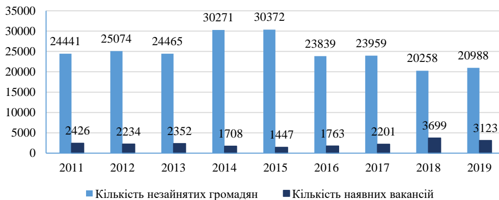
Рисунок 1. Попит та пропозиція робочої сили на ринку праці Полтавського регіону, 2011-2019 рр.

Враховуючи дані Головного управління статистики у Полтавській області [4], здійснено аналіз відповідності попиту та пропозиції на ринку праці Полтавського регіону та встановлено, що незважаючи на позитивні тенденції на ринку праці, головною проблемою залишається низький попит на робочу силу, що в разі нижчий за пропозицію (рис. 1).