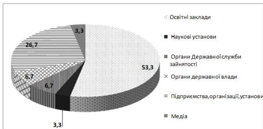
Рисунок 1. Розподіл експертів, залучених до дослідження «Загрози соціальній безпеці на ринку праці України та шляхи їх нейтралізації» за сферами професійної діяльності

У результаті експертного опитування визначено як конкретні перешкоди та загрози соціальній безпеці на ринку праці, так і перспективи усунення. Враховуючи структурно-логічні особливості дослідження у якості першого етапу експертного опитування було проведено оцінку ступеня значущості чинників, які у найбільшій мірі перешкоджають розвитку ринку праці в Україні. Важливим в процесі характеристики основних перешкод розвитку ринку праці є їх ранжування за рівнем отриманих експертних оцінок. Відповідні результати наведені у таблиці 1.