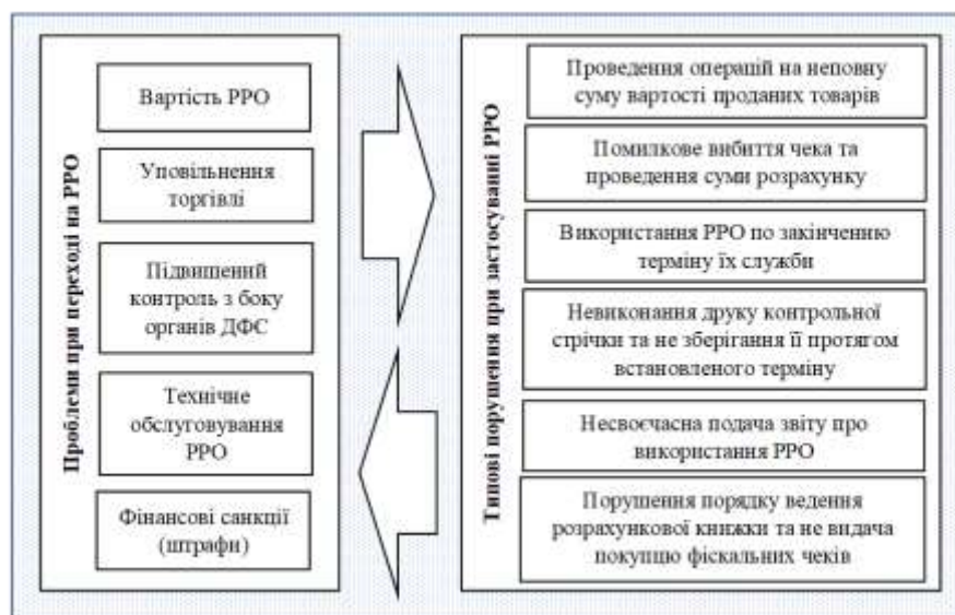
Рисунок 3. Проблеми підприємців при переході на РРО та типові порушення їх застосування

Проблема вартості РРО є частково вирішеною запровадженням ПРРО, але для його використання також потрібний носій, тобто в будь-якому випадку необхідно придбати гаджет, а за наявності декількох торгових точок витрати підприємця багатократно зростають. Постає питання щодо використання одного РРО для декількох магазинів. Однак, згідно з законодавством, РРО може застосовуватись тільки в тій господарській одиниці, назва та адреса якої зазначені в реєстраційному посвідченні.