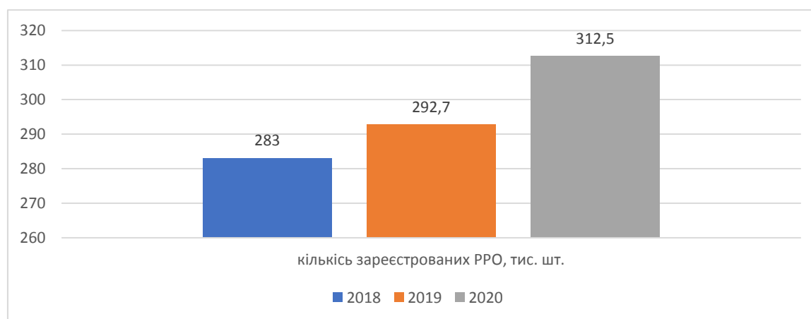
Рисунок 1. Кількість зареєстрованих в Україні РРО 2018-2020 рр.