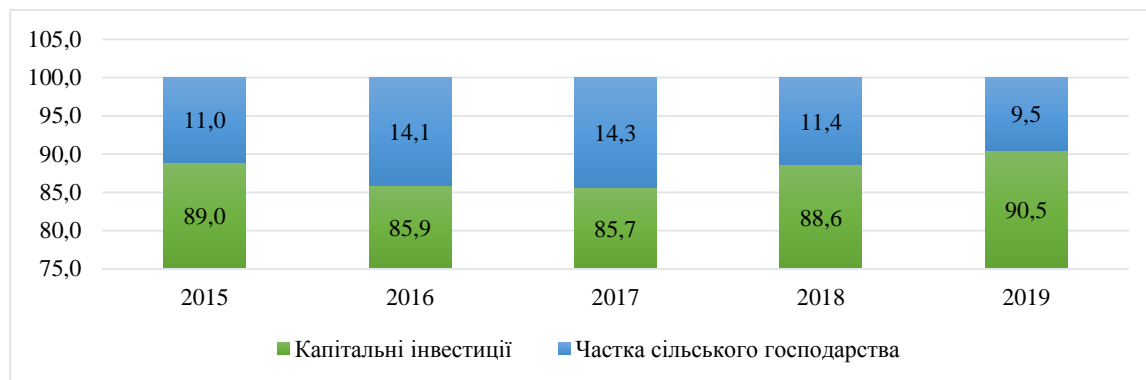
Рисунок 5. Частка інвестицій в сільське господарство в загальній структурі інвестицій в основний капітал, % [5]

Результати соціологічного опитування, проведеного компанією «Делойт», дозволяють виділити ряд ключових проблем, з якими стикаються компанії агропромислового комплексу України в процесі своєї діяльності. Зокрема, до них можна віднести: недосконалість державного регулювання галузі, недостатню державну підтримку і фінансування, низький виробничо-технічний потенціал, валютні ризики, непривабливість даного бізнесу для зовнішніх інвесторів, геополітичні ризики, негнучкість податкової системи та інші (рис. 6) [6].