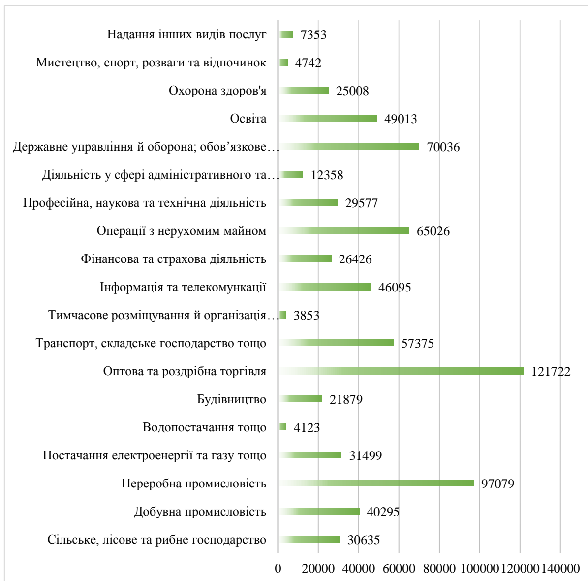
Рисунок 2. Виробнича структура ВВП за 2020 рік (млн. грн.) [5]

Аналіз стану АПК України на основі даних Державної служби статистики України показав, що сільське господарство (включаючи рибальство) входить в 10 провідних секторів національної економіки за часткою в ВВП – 9-е місце (рис. 2) [5].