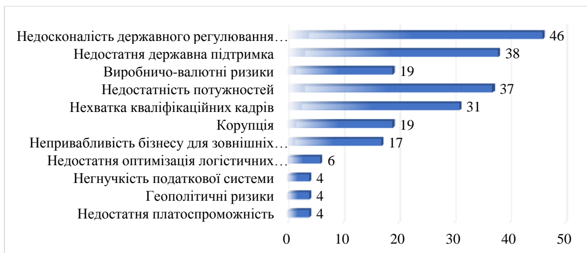
Рисунок 6. Рейтинг проблем бізнесу АПК в 2019 році [6]

Результати соціологічного опитування, проведеного компанією «Делойт», дозволяють виділити ряд ключових проблем, з якими стикаються компанії агропромислового комплексу України в процесі своєї діяльності. Зокрема, до них можна віднести: недосконалість державного регулювання галузі, недостатню державну підтримку і фінансування, низький виробничо-технічний потенціал, валютні ризики, непривабливість даного бізнесу для зовнішніх інвесторів, геополітичні ризики, негнучкість податкової системи та інші (рис. 6) [6].