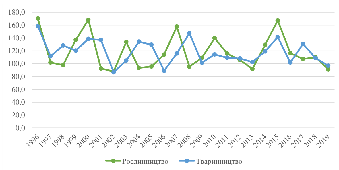
Рисунок 4. Індеси цін реалізованої підприємствами продукції сільського господарства (% до попереднього року) [5]

Динаміка цін на сільськогосподарському ринку за основними блоками – рослинництво і тваринництво - демонструє істотні коливання обох блоків (рис. 4).