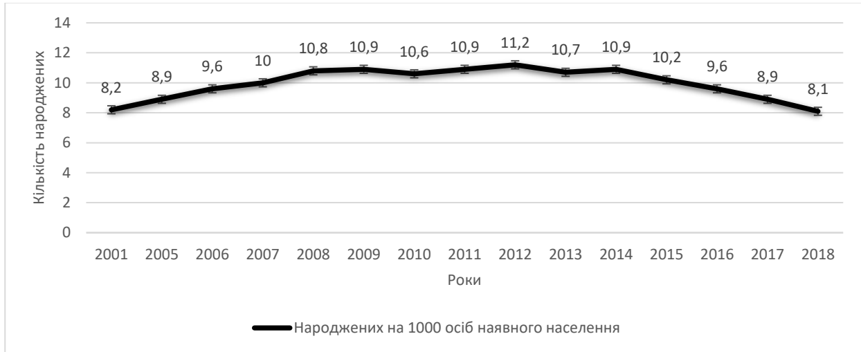
Рисунок 1 - Динаміка народжуваності у Вінницькій області у 2001–2018 роках [4]

У 2001 р. рівень народжуваності становив 8,2 народжених на 1000 жителів, а в 2018 р. – 8,1, що на 0,1 в.п. менше, ніж у 2001 році, цю інформацію представлено на рисунку 1.