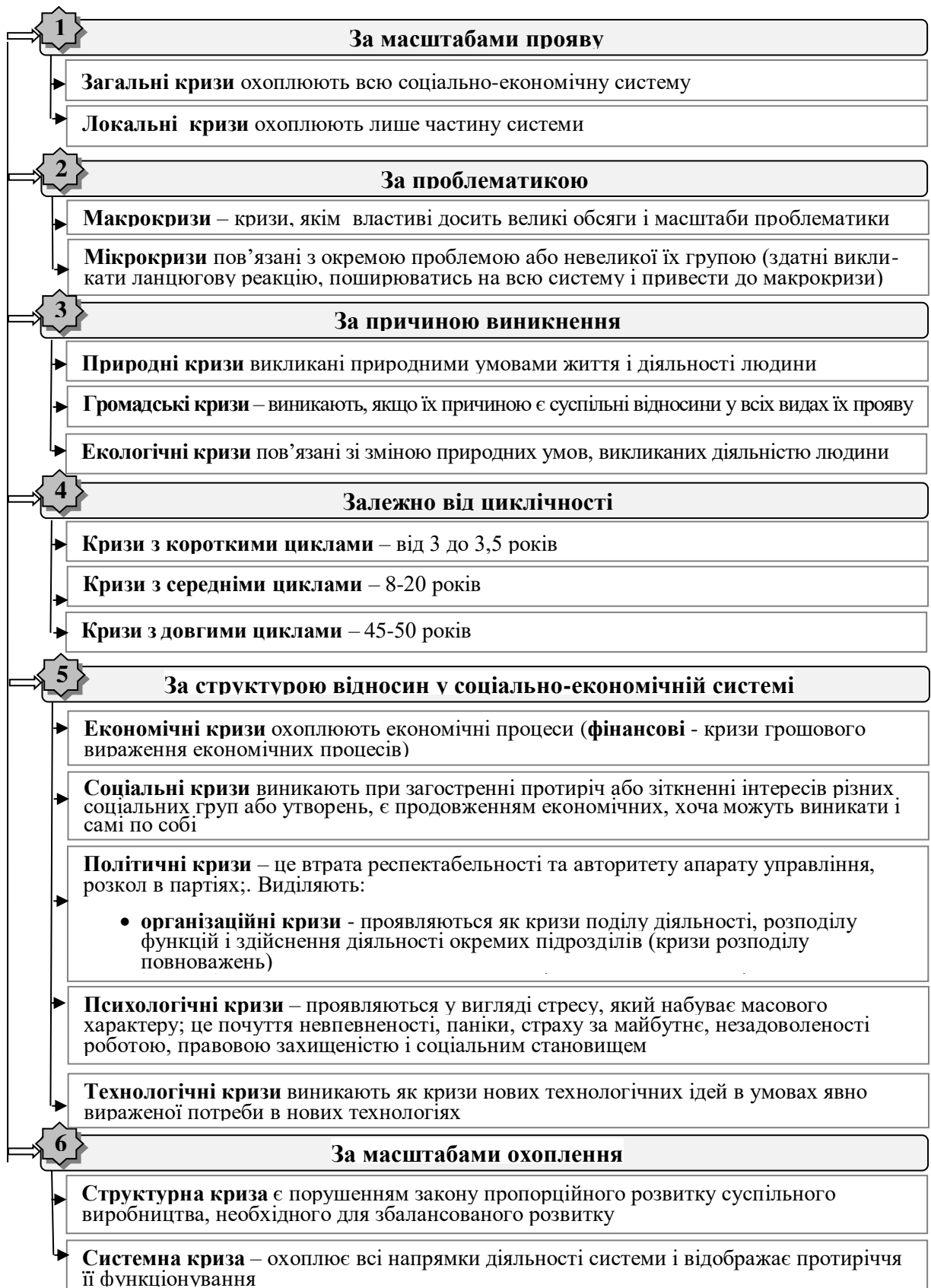
Рис. 1. Класифікація світових криз