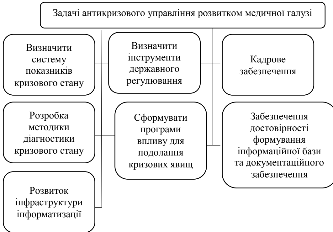
Рис. 1. Задачі антикризового управління розвитком медичної галузі

- Інформованості – достатній рівень інформатизації, інформаційно-документаційного забезпечення.