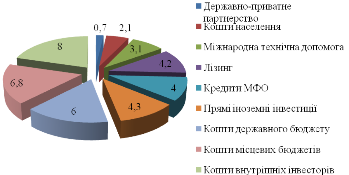
Рис. 3. Результати опитування респондентів щодо можливих джерел фінансування проектів та заходів, пов'язаних з регіональним розвитком

Більшість експертів досить високо оцінили можливість фінансування з коштів державного бюджету. Натомість, аналіз структури капітальних інвестицій 2015 р. засвідчив, що воно не було вагомим. Крім того, бюджетне планування відірване від загальнодержавного планування, основна частина видатків спрямовується на утримання та соціальні видатки, на врегулювання військового конфлікту, і тому розраховувати на значне фінансування з державного бюджету проектів розвитку не доводиться.