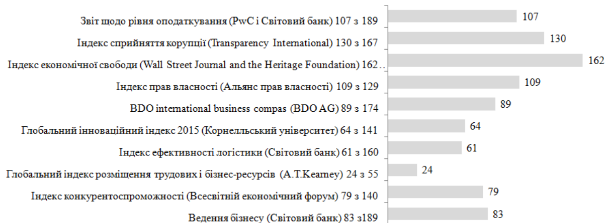
Рис.4. Україна в міжнародних рейтингах (2016) [5]

Перелік факторів є неоднаковими в різних рейтингах, що обумовлюється геополітичною ситуацією, тенденцією світових глобальних економічних та інвестиційних процесів тощо (рис.4).