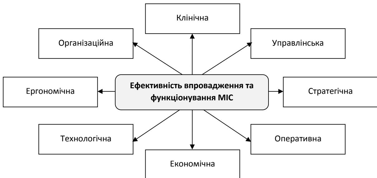
Рис. 2. Складові ефективності впровадження та функціонування МІС

Виходячи з викладеного вище, складові ефективності впровадження медичної інформаційної системи в закладах охорони здоров'я та її функціонування показані на рис. 2.